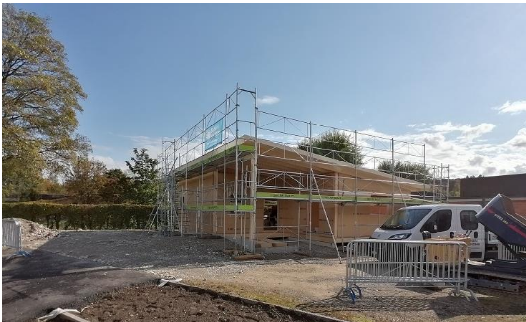
Der neue Jugendraum bei der Badi nimmt Gestalt an