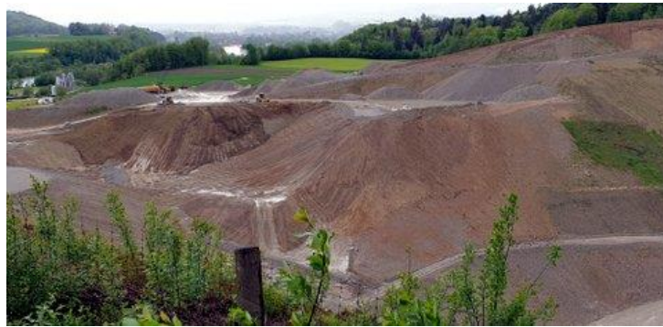
Kiesgrube im Umbruch